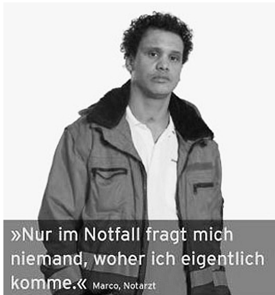
Rassismus und Exotismus sind voneinander zu trennen (Abb. 3)

«Miss World 2009» aus Gibraltar komme, was zu den «exotischen» Ländern «kaum gezählt werden» könne. Das Beispiel verdeutlicht, dass wer oder was als «exotisch» gilt, auch in unserem Alltagsgebrauch eindeutig ist; dass Weiße Menschen nicht unter die Kategorie «exotisch» zu fassen sind, scheint offensichtlich. «Exotisch» ist also eine rassialisierte Kategorie und deren ideologischer Gehalt lässt es sinnvoll erscheinen, von Exotismus zu sprechen.